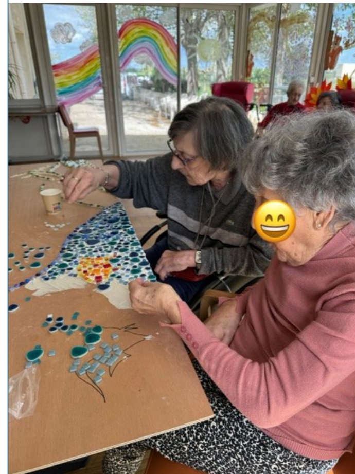
Atelier mosaïque du 9 avril !