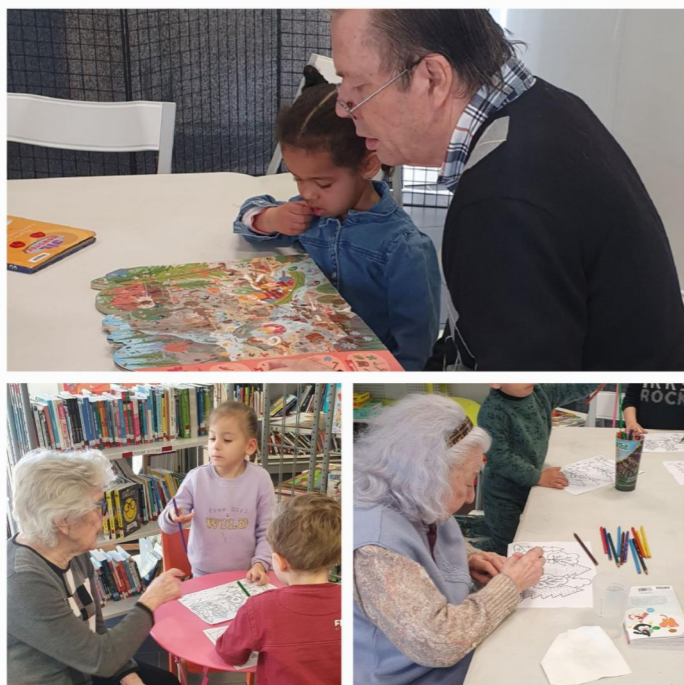
comme un jeudi matin à la médiathèque...