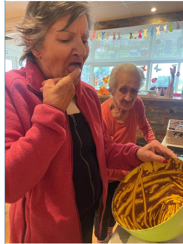
Rien n'est meilleur que de lécher le plat de mousse au chocolat.