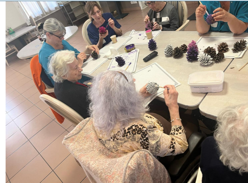
Hier après midi atelier créatif, nous étions en train de terminer notre bouquet de pommes de pin.