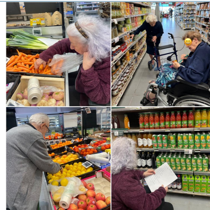
Apéro-thérapeutique du 15 avril Nous sommes tout d'abord allés faire les courses !