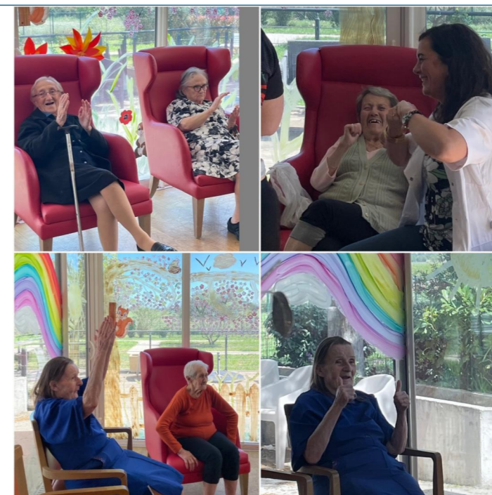
Avec un peu de retard, voici les photos du yoga du rire, qui s'est déroulé au P'tit Domaine le 11 avril