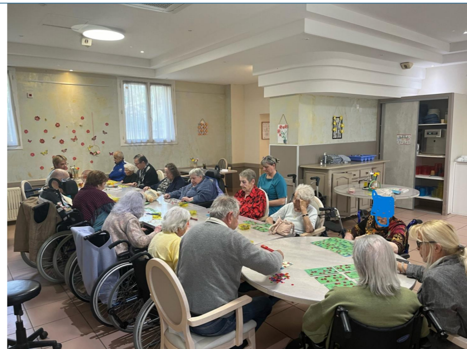
Le loto du mercredi tant attendu