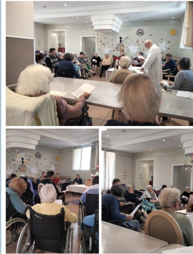
Temps de prière pour ce vendredi 12 avril