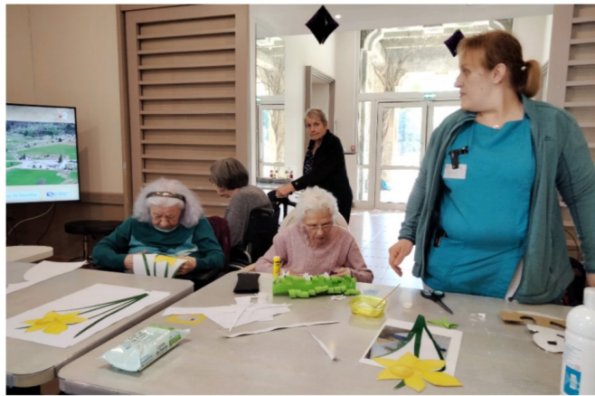
Préparatifs décoration de l'ETE