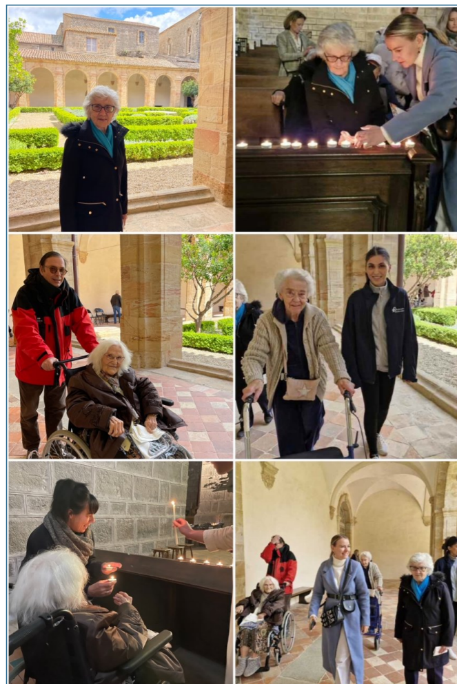
Abbaye de Lagrasse, le 18 avril. La journée s'est conclue par une petite visite de l'abbaye !