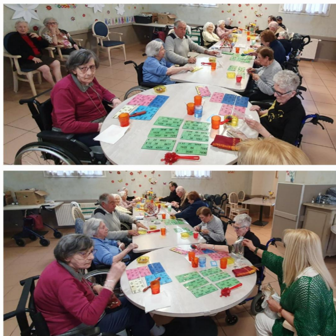
le loto attendu par tous, tous les mercredis après-midi.