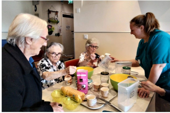
Atelier pâtisseries avec les résidents coté EHPAD ainsi que les résidentes du P'tit Domaine.