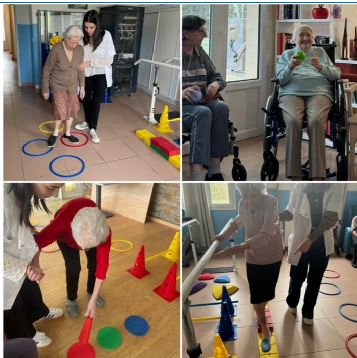
Retour en image sur les ateliers moteurs de la semaine ! Lundi c'était gym douce et parcours équilibre et mardi, parcours équilibre au P'tit Domaine