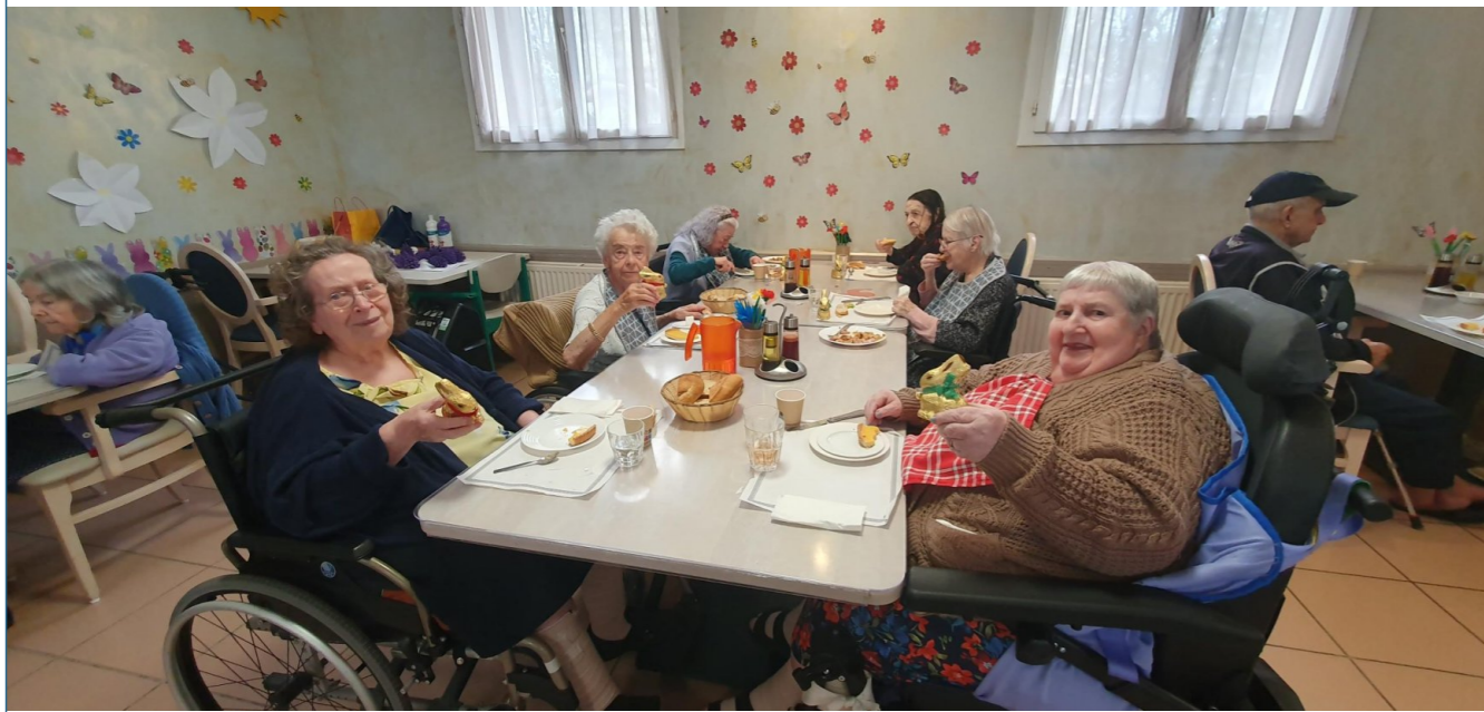
dimanche de pâques à la bourgade, merci les cloches !!! ;)