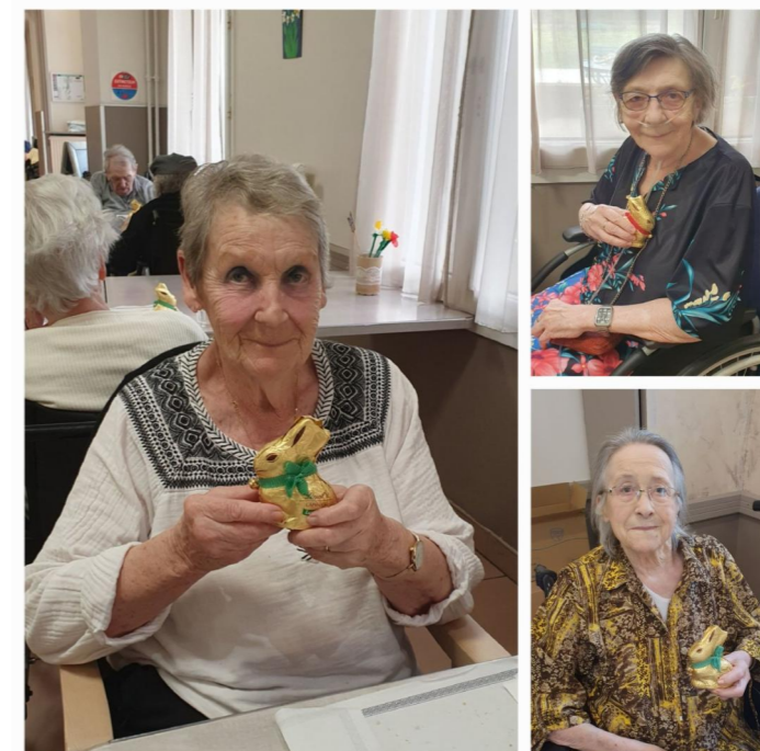
Dimanche de Pâques à la Bourgade, les résidents étaient très contents de leurs lapins en chocolat offerts par les cloches ;)